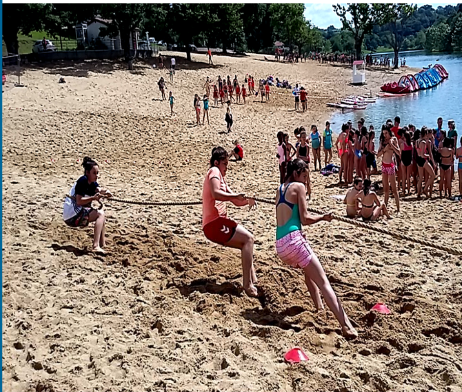
Raid juin 2017

De nouveaux tests à la rentrée pour les collégiens qui n'auraient pas pu effectuer les tests en